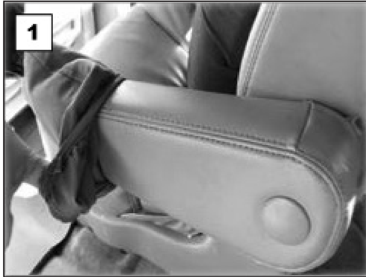
Coloque la cubierta sobre la pieza del descansabrazos