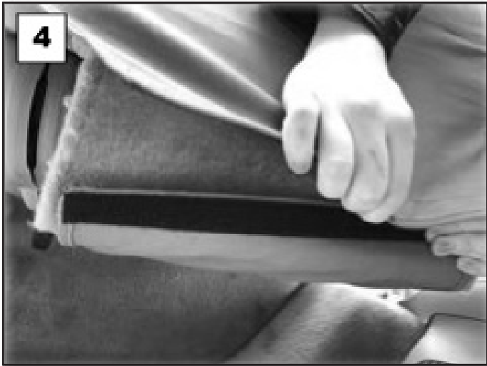
Conecte el velcro