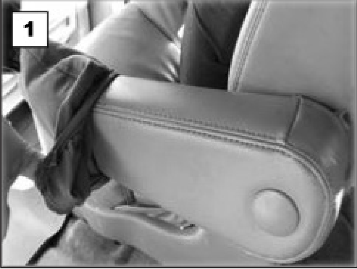
Disposer la housse sur l'accoudoir.