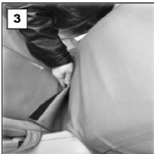
Tuck bottom edge of seat cover between the seat and the backrest

Ensure the dots are visible and aligned to the Child seat attachment anchors