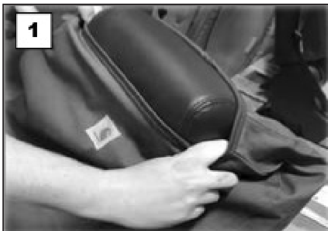
Place cover over and around the seat