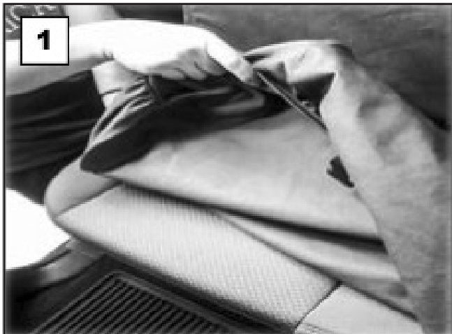
Coloque la cubierta y empuje la cubierta sobre el asiento