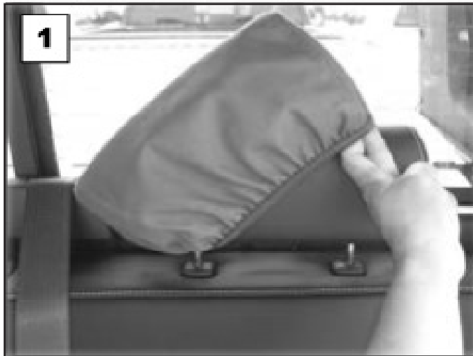
Glisser la housse sur l'appuie-tête.