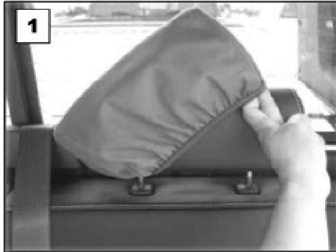
Slide cover on the headrest