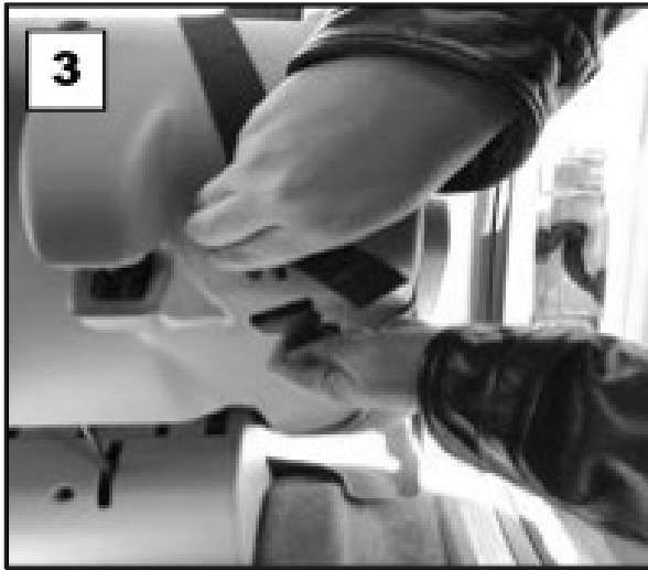
Conecte la hebilla y jale ligeramente para asegurar la cubierta