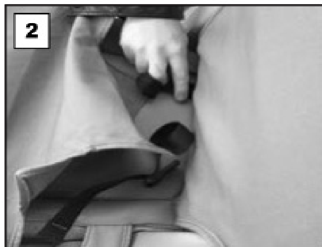
Pousser la housse entre le dossier et la base du siège pour fixer la housse.