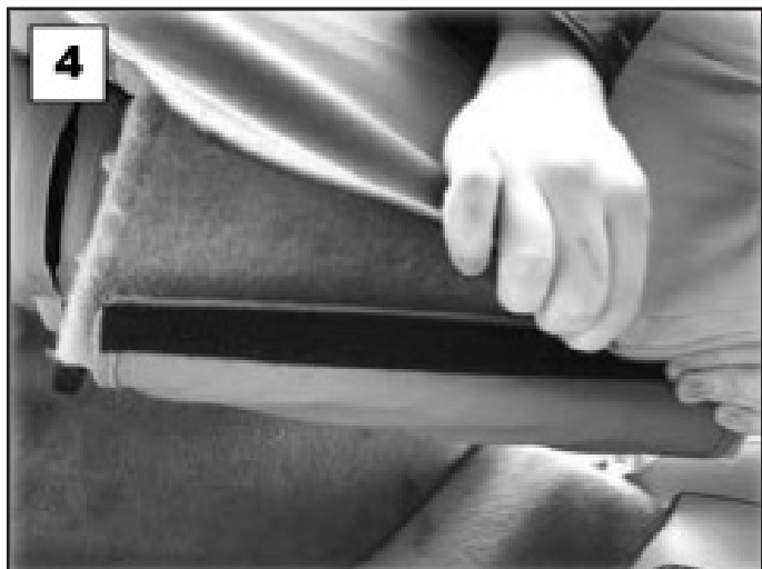
Fixer la bande velcro.