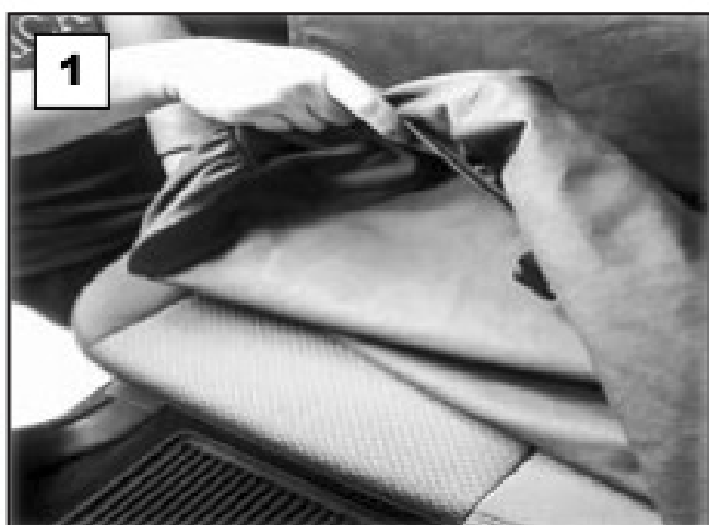
Disposition de la housse et pousser la housse par-dessus le siège.