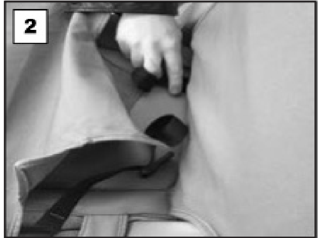
Empuje la cubierta entre el respaldo y el fondo para asegurar la cubierta